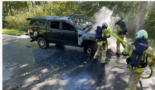
20. September Verkehrsunfall mit Fahrzeugbrand Stans