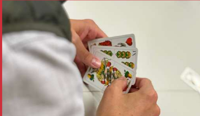
26. März Watterturnier 2025 Feuerwehrhaus