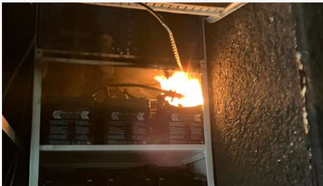
17. September Elektrobrand VZ Jenbach