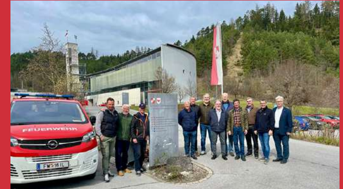
28. März Reservistenausflug an die Landesfeuerwehrschule Tirol