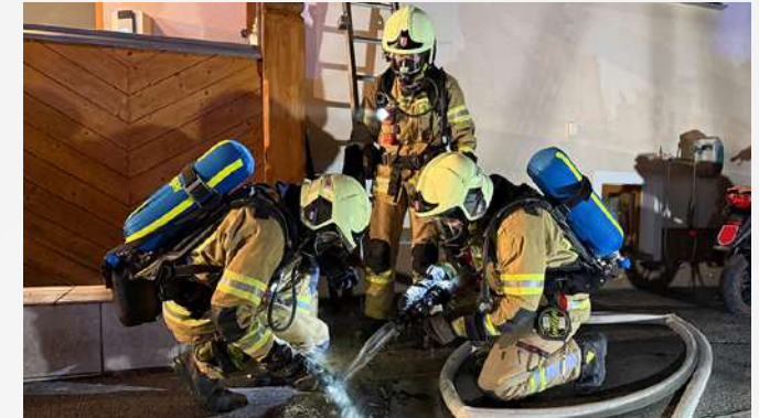
26. August Explosion Staubsauger-Akku Am Sportplatz