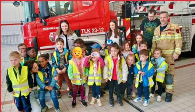
02. Mai Besuch Gemeindekindergarten Jenbach