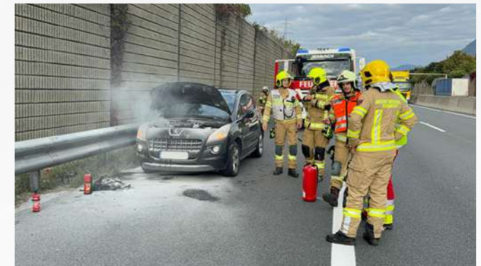
29. September Fahrzeugbrand A12 - Jenbach