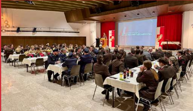
08. März 151. Jahreshauptversammlung