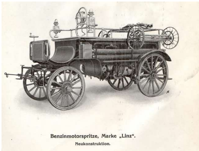
Benzinmotorspritze, Marke „Linz“. Neukonstruktion.

1913 23.09. Teilt der Gemeindeausschuß schriftlich mit, dass dem Ankauf der Benzin Motor Turbinen-spritze Marke Linz 1, von der Firma Rosenbauer und Kneitschel in Linz genehmigt wurde.