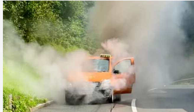
01. August Gemeldeter Fahrzeugbrand L7 - Jenbacher-Straße