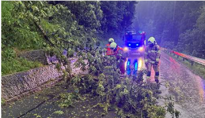
19.-20. Juli Unwettereinsätze Ortsgebiet Jenbach